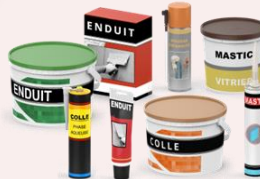
Enduit, colle, mastic, résine.