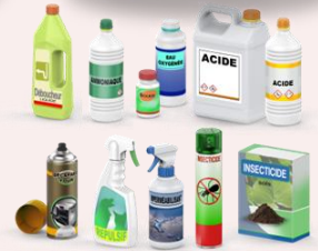
Déboucheur canalisations, ammoniaque, soude, acides, eau oxygénée, décapant four, répulsif ou appât, imperméabilisant, insecticide, raticide-rodenticide, produit de traitement des matériaux (dont bois).