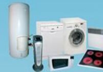
Lavage / Cuisson / Chauffage