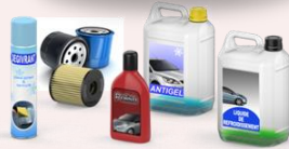
Antigel, filtre à huile, polish, liquide de dégivrage, liquide de refroidissement, anti-goudron.