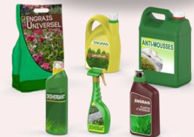
Engrais non organique, anti-mousses et moisissures, herbicide, fongicide.