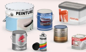
Peinture, vernis, lasure, pigment couleurs.