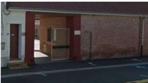
Extérieur de la salle : On y effectue l'accueil du public.

Nous avons également à notre disposition la salle de sport intercommunale de St Pol sur Ternoise selon nos besoins.